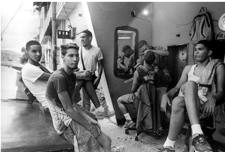
Barbero Y Culebra