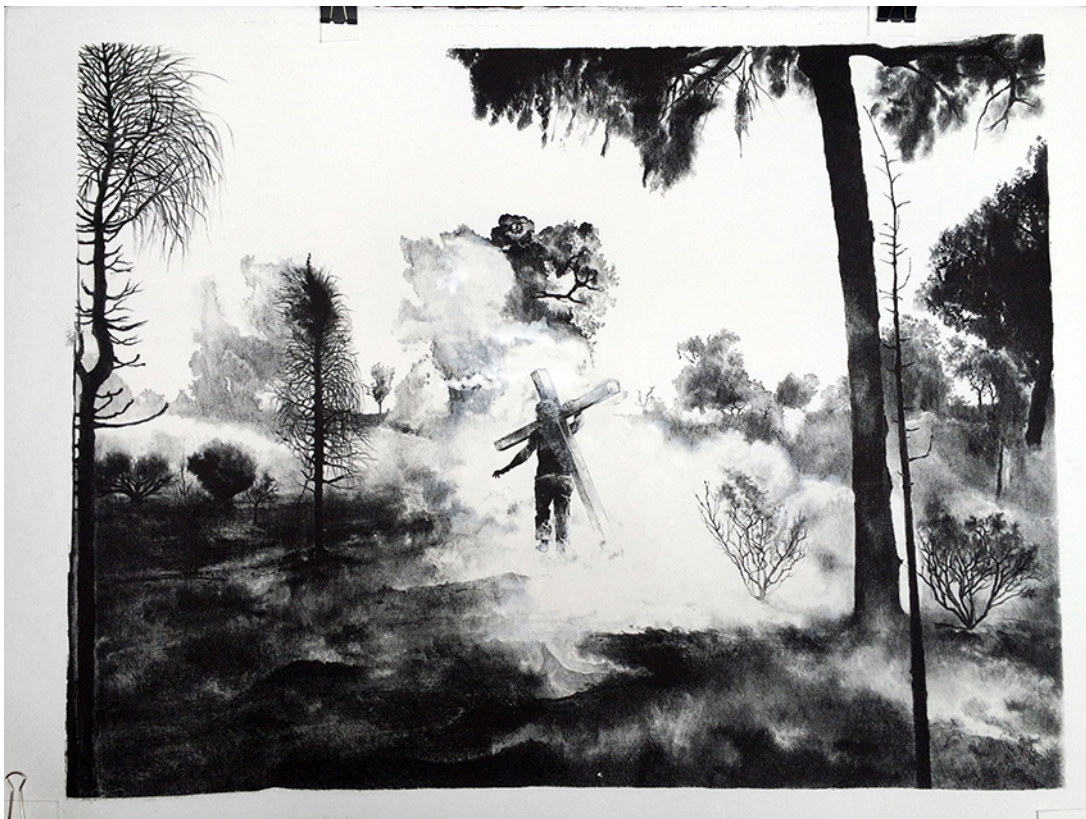
"Le Crucifié" , lithographie sur papier Rives, 52 x 65 cm, 2016