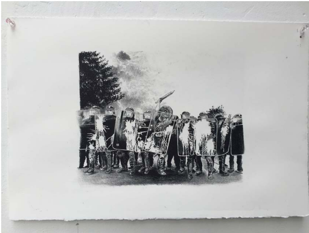
"Res Publica" , lithographie sur papier Rives, 33,5 x 50,5 cm, 2016