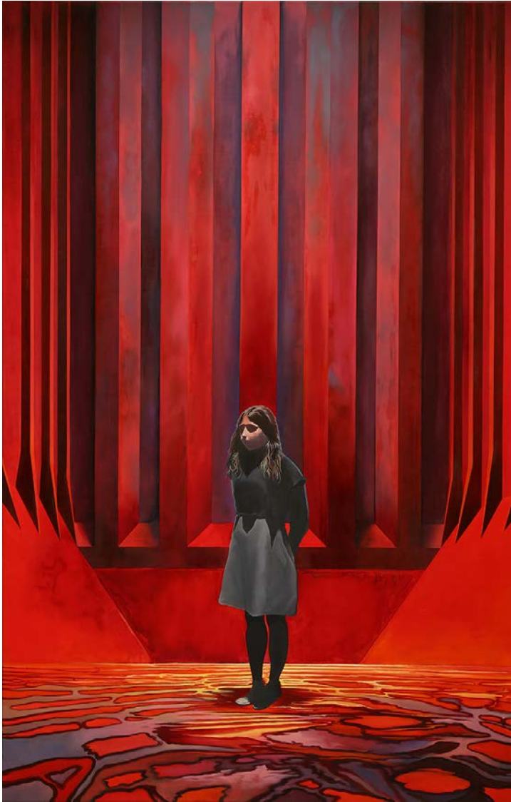
"Perséphone" , huile et peinture à carrosserie sur toile, 190 x 120 cm, 2017