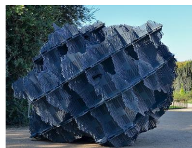
Sans titre - Vincent Mauger. Jardin des Tuileries. Paris Œuvre de Vincent Mauger, 2012.