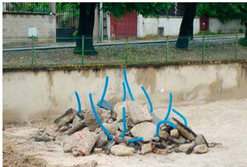
Laurent Lacotte, Bouquet de chantier, 2016 – Tuyaux de construction en plastiques trouvés sur un chantier et réagencés sur tas de pierre et gravas, Migennes.