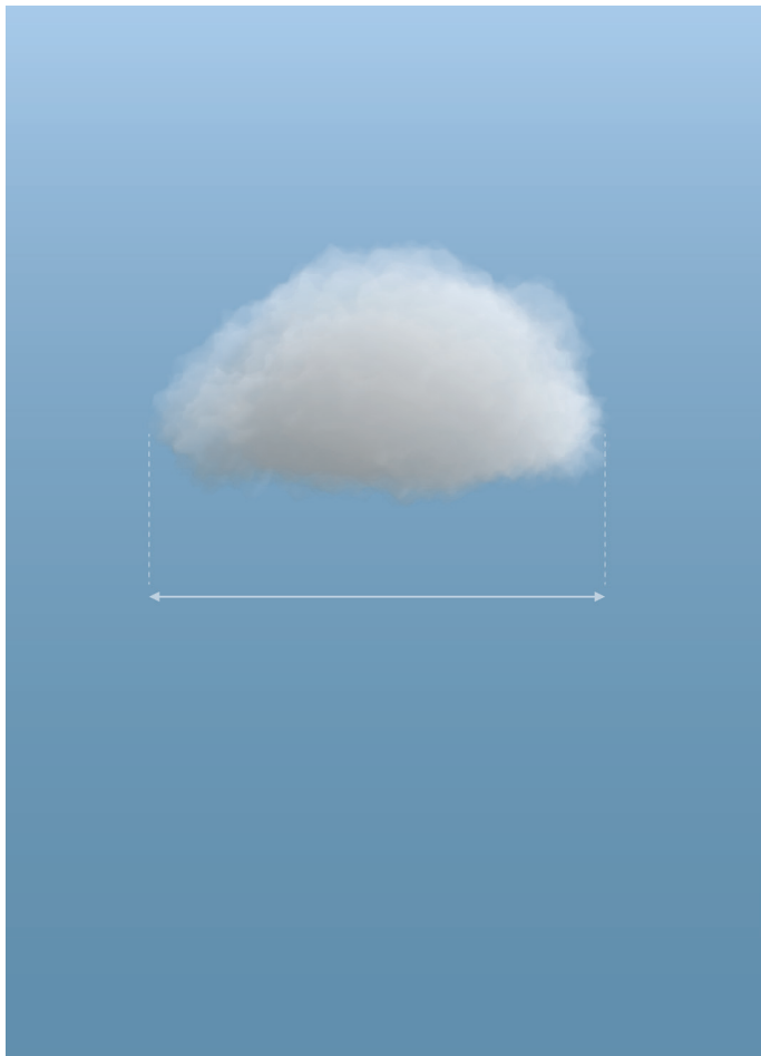
NUAGE (c) N. Lelièvre

C'est également dans cette optique altruiste et utopiste qu'il illustre ses réflexions sous forme de bandes dessinées pour les rendre accessibles à tous. Cela donnera lieu à une diffusion de ses dessins dans le monde entier par l'UNESCO, et en 2011 à des séries de dessins animés. Une sélection de 4 de ces dessins animés seront visibles pendant l'exposition à la Galerie !