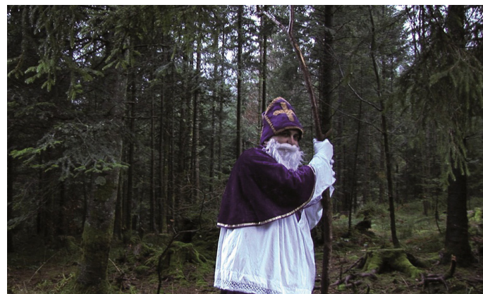
Eléonore Saintagnan, Un film abécédaire , 2011 Production red shoes @ L'artiste