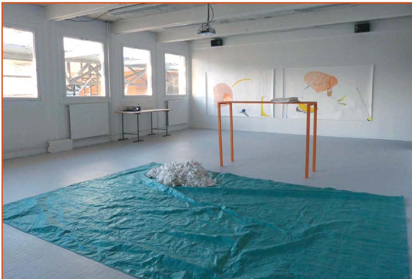
Travaux de Lorette Havond, présentés lors du DNSEP art 2015, ÉSAD •Valence.