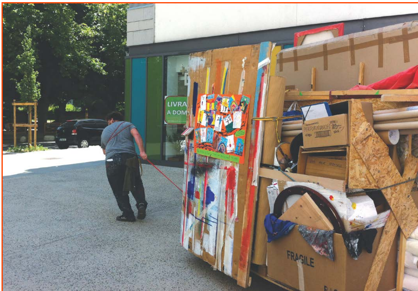
Performance de Fabien Bonzi, lors du DNSEP art 2015, ÉSAD •Grenoble.