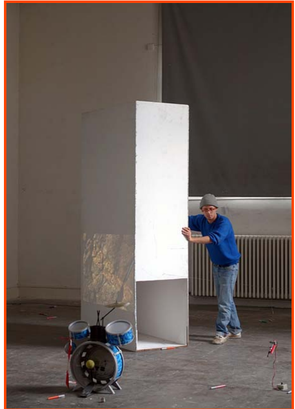
Samson Pignot, Feutre , 2017, dimensions variables, performance sonore (20 min.).