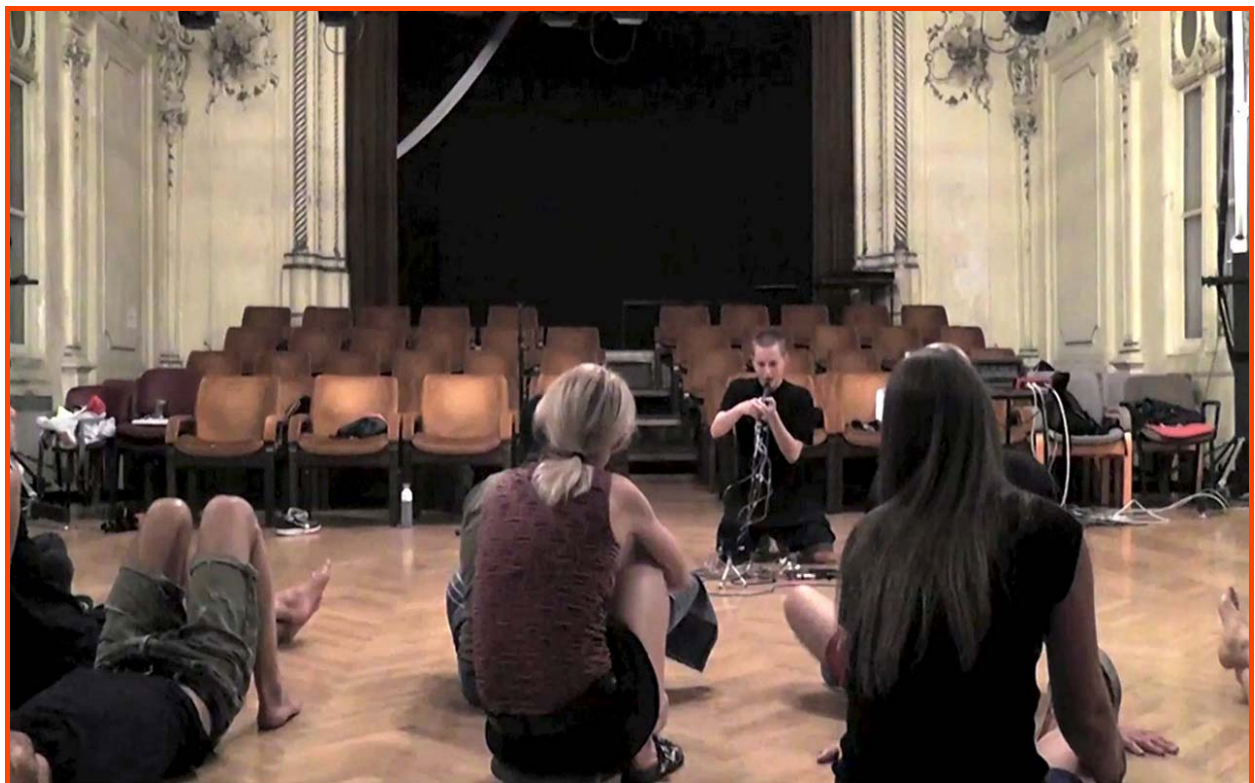
Aela Royer, À la surface(s) , 08-2017, dimensions adaptables au lieu, performance (20 min.).