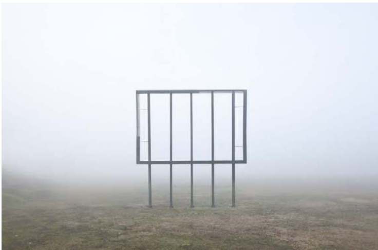
Roberto Venegoni, Série Confini Boundaries

Photographe documentaire, particulièrement intéressé par le paysage, l'espace urbain et les endroits abandonnés, Roberto Venegoni présente cette fois-ci un projet sur le brouillard, telle une frontière réelle du visible, telle une métaphore de l'image (ou même de mémoire) qui disparaît. Il nous amène sur les plaines de Pô (une région du nord de l'Italie), durant les mois d'hiver, au moment où le brouillard devient à la fois une partie de paysage et un élément étheré qui impose une frontière au regard.