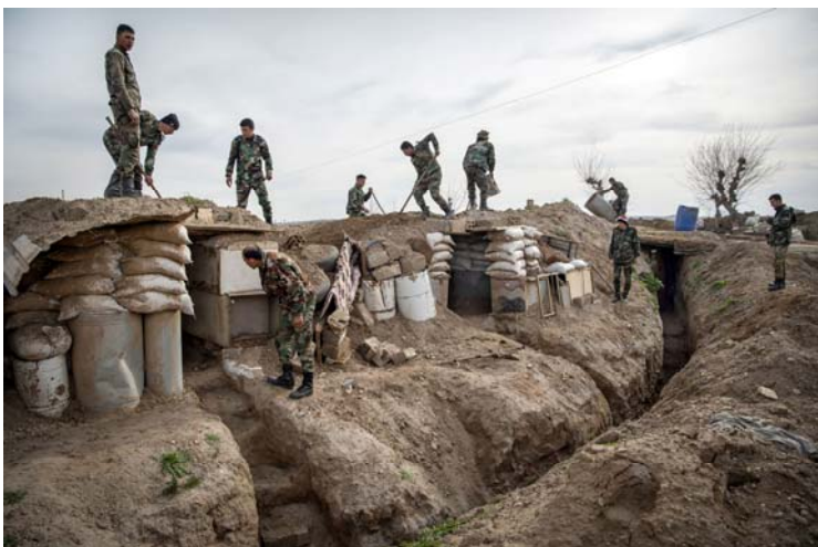
Giorgio Bianchi, Siryia, the slow return to life

Au-delà du témoignage de la situation réelle de guerre, des villes rasées par des combats, Giorgio Bianchi cherche à montrer le retour progressif à la vie pour les populations civiles.