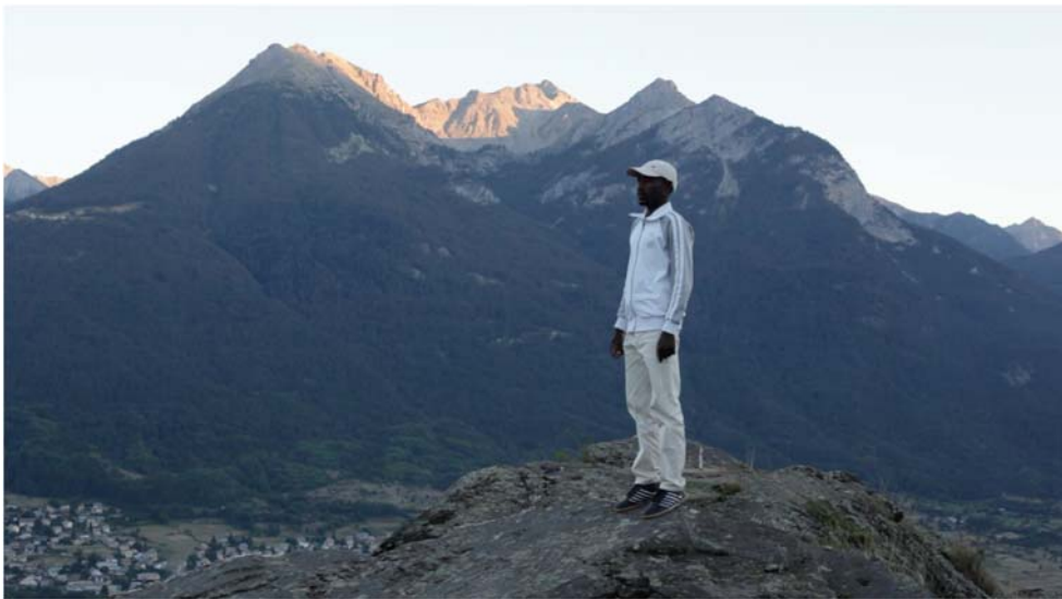
Fatima Bianchi, De l'autre côté des montagnes (France, 2017, 35 min.)

Artiste visuelle et réalisatrice de documentaires de création, Fatima Bianchi présente pour (In)visible deux films documentaires : Notturmo (2016, 15 min.) et De l'autre côté des montagnes (2017, 35 min.), questionnant dans ces deux projets les frontières géopolitiques et les frontières invisibles du sensible.