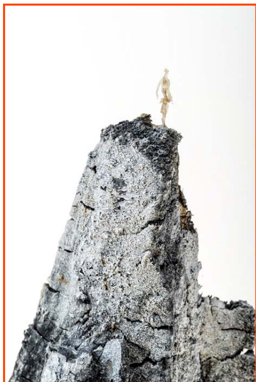
Massif de la luciole (gros plan), 2016, reste de feux, ongles, peaux mortes, vernis