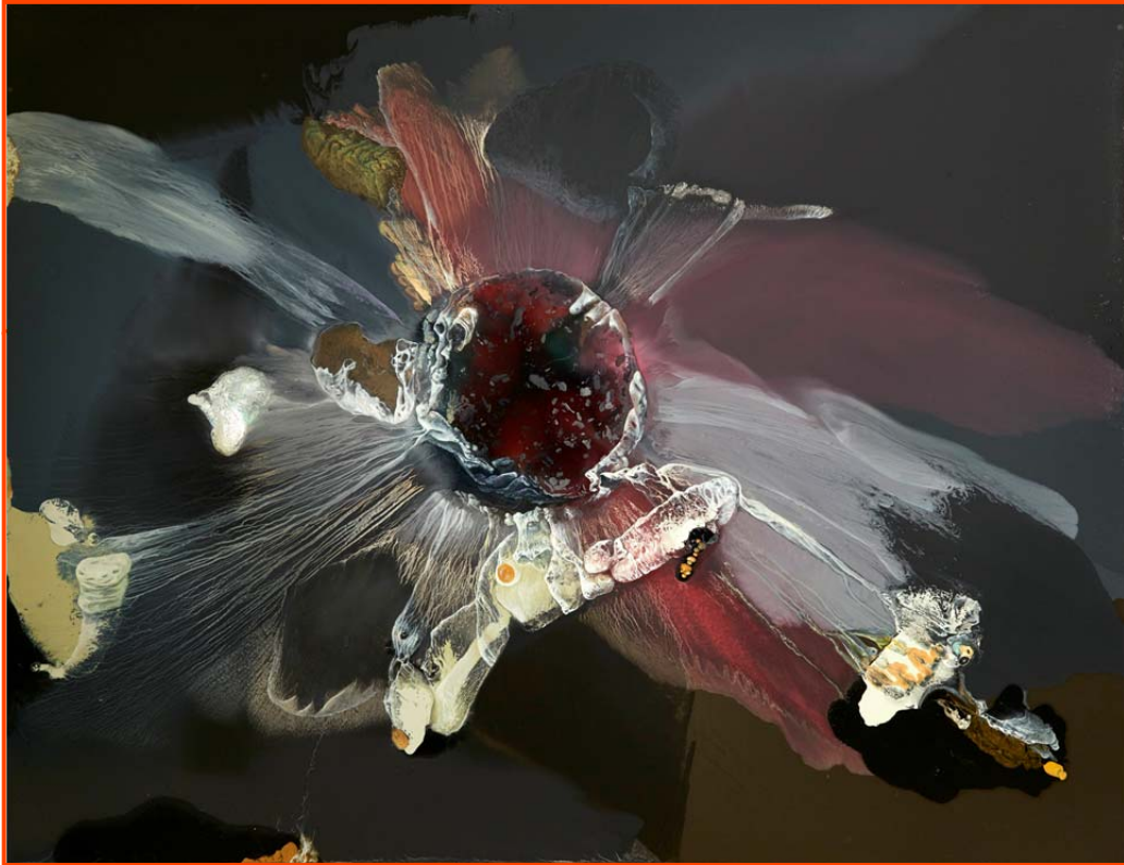
Sève hurlante, souvenir du Grand Morne, 2016, 230 x 300 cm, huile sur toile