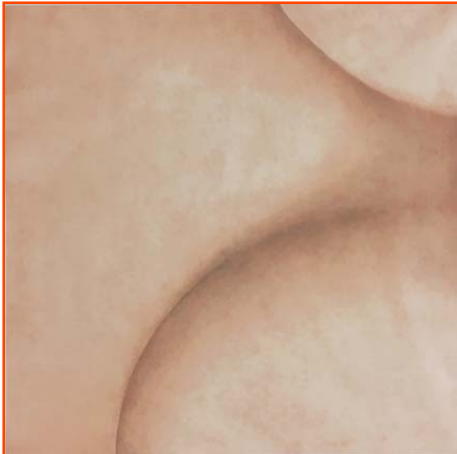
Sujin Cho, Portrait , 2018. Peinture, 200 x 200 cm.