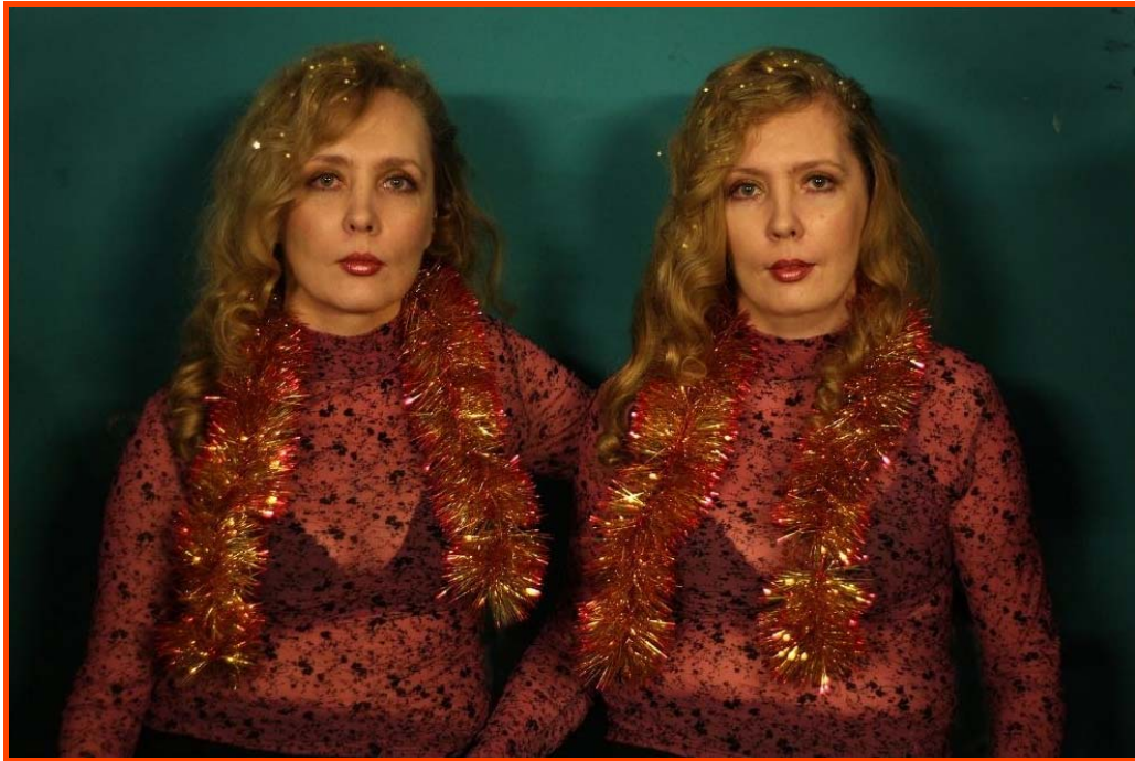
Sofya Balasheva, Le reflet , 2018. Photographie sur carton plume, 60 x 90 cm.