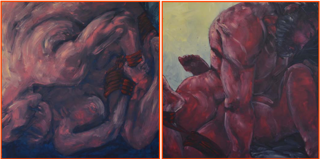
Mélissa Verbo, Catch me , n°5 et n°9, 2018. Peinture acrylique, 100 x 100 cm.