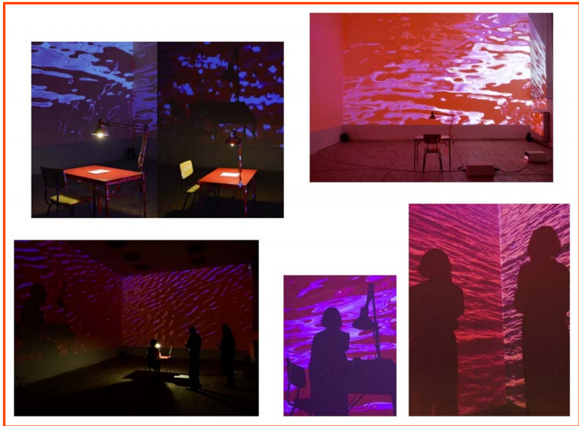
Wonyoung Kim, Complexe de Jonas , 2018, installation.