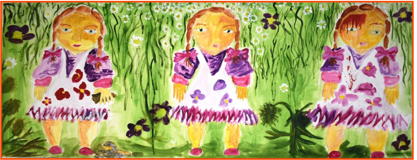
Gabriel Ott, Jardin anglais , 2017, acrylique sur toile, 203 x 77 cm.