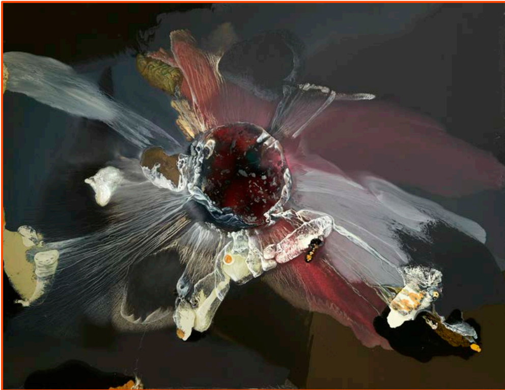
Sève hurlante, souvenir du Grand Morne, 2016, 230 x 300 cm, huile sur toile.