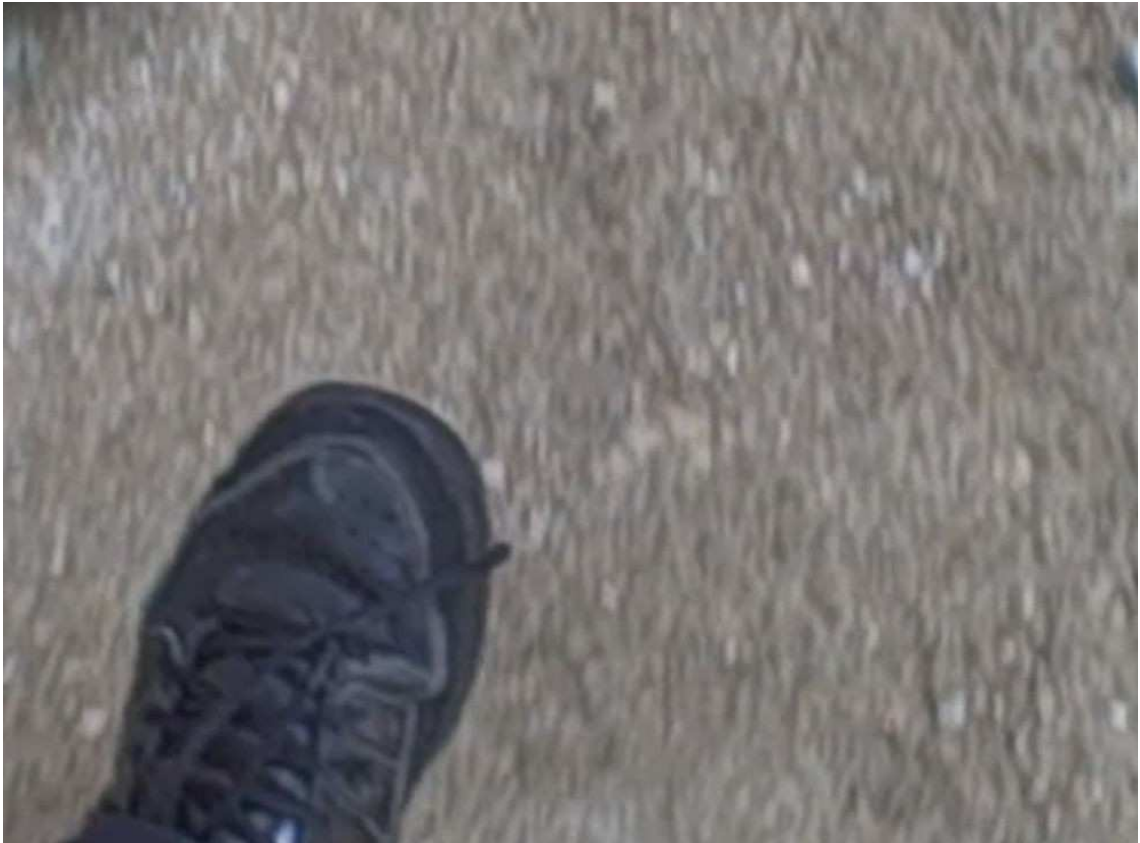
Clôde Couplier, Là où l'on décide de s'arrêter , photographie numérique