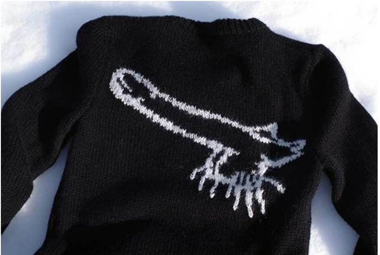
Jaanus Samma, Wings , alpaga, tricoté par Anu Schotter (série Sweaters )