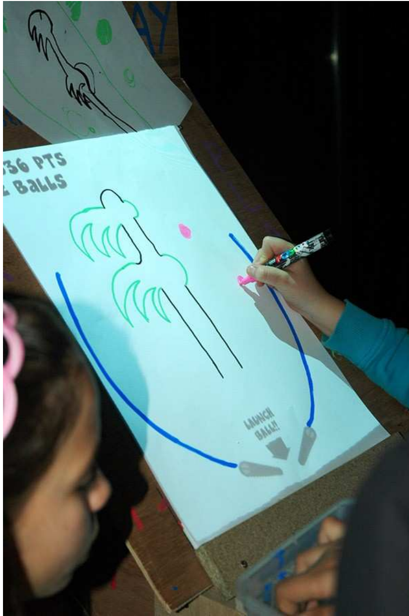
Enfants jouant à Flippaper Bêta , festival les Pixels, Beauvais, 2013