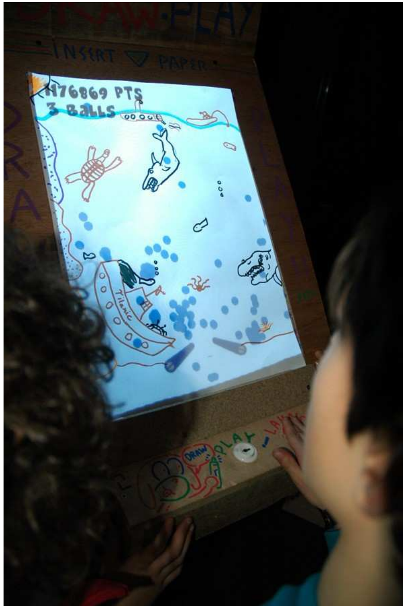
Enfants jouant à Flippaper Bêta , festival les Pixels, Beauvais, 2013