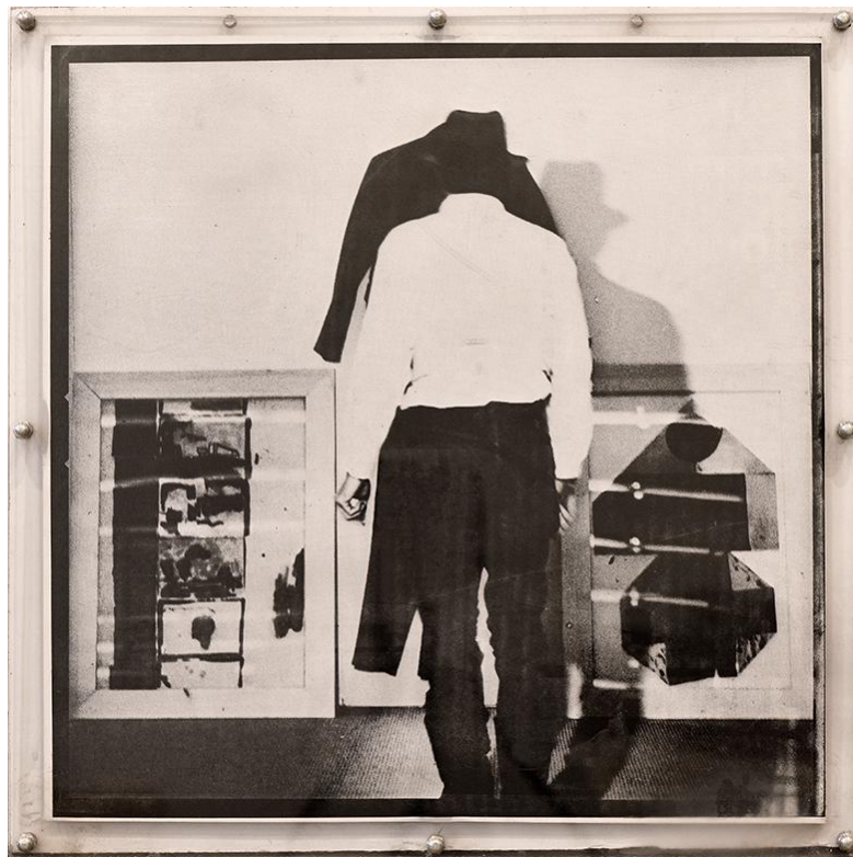
Joseph BEUYS 3 Ton Edition, 1973-1985 Sérigraphie, recto verso Signature au recto 63 x 63 cm