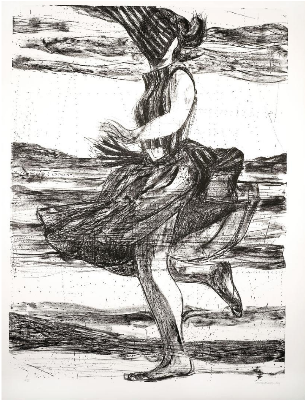
Marc Desgrandchamps La bacchante, 2005 Lithographie sur papier Sahnemühle 152 x 110 cm (hors cadre)