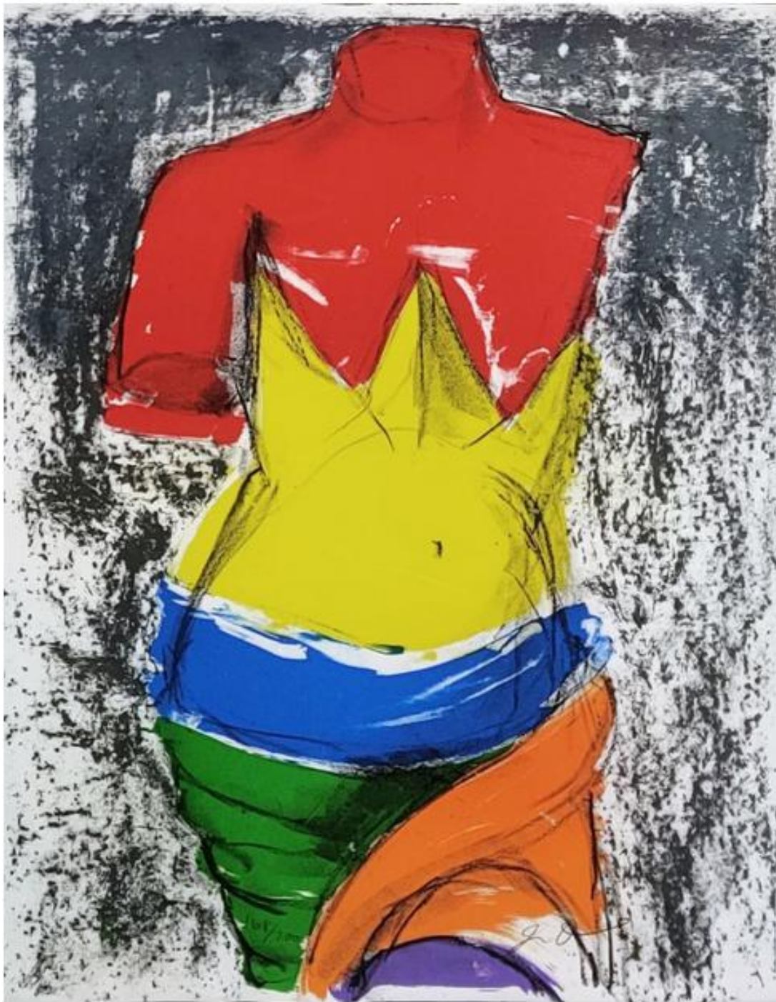
Jim Dine The Bather - 2005 Lithographie originale sur vélin d'Arches 250 g. Ex n° A/P 50 x 65 cm