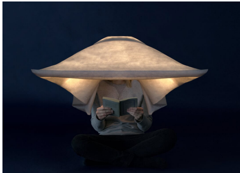
Miriam Betoux en collaboration avec Camille Mariot, Cappa, mise en situation de l'objet lumineux, 2015.