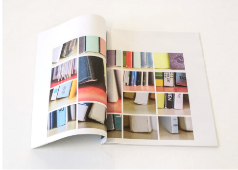
Miriam Betoux, Observation, édition papier grand format, 2015.