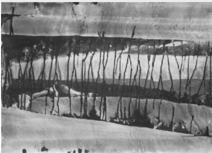
Black Rain /