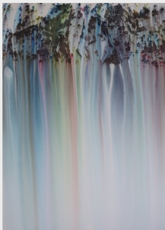
waterfalls / peinture acrylique sur papier