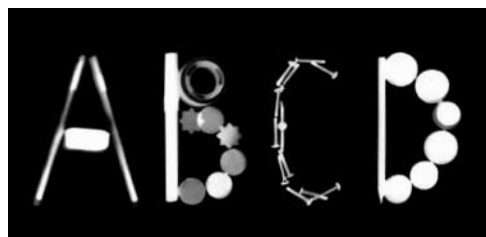
Intervention de Gwendoline Dulat (CFPI, 2013). Alpha louve (extrait). École Louvois, Strasbourg.

Une fois la formation suivie, le stagiaire est intégré dans un annuaire d'artistes intervenants formés à la HEAR. Une documentation réalisée en lien avec le stagiaire est envoyée à un panel de structures françaises potentiellement intéressées.