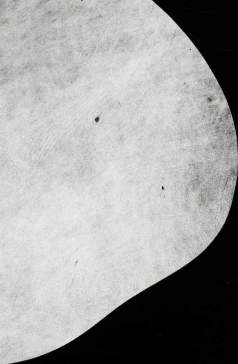
Caroline Gamon, La Zone , extrait de Dans la nuit de mercredi à dimanche . Gouache et collage sur papier, 39 × 29 cm, 2011