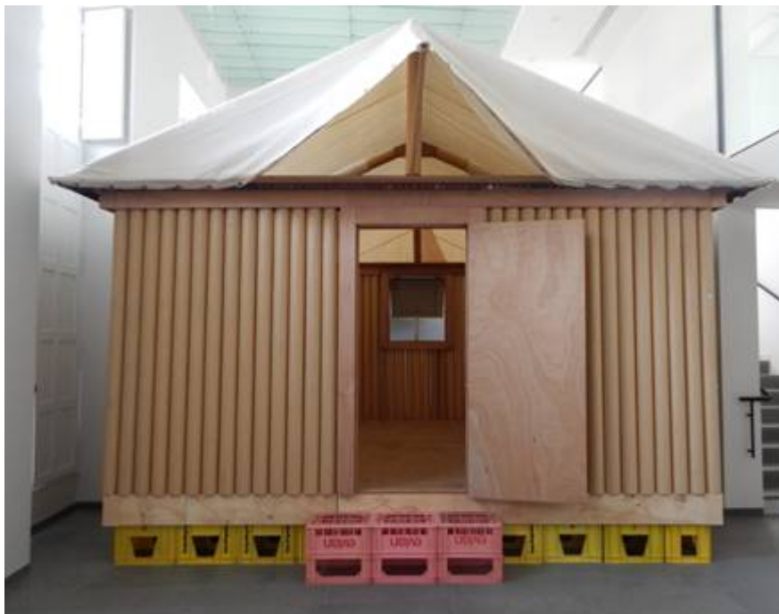
Shigeru Ban, Paper Log House, 1995, Collection du Consortium de Dijon