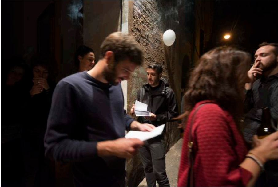
Walking from Scores, Catacomb Bomb, Raum, Bologna, octobre 2014. Distribution des partitions.

En embrassant cette ouverture, la collection est à chaque fois réactivée de manière différente et en forme dispersée et itinérante à partir d'une réflexion sur la géographie de l'événement et en dialogue avec le contexte d'accueil.