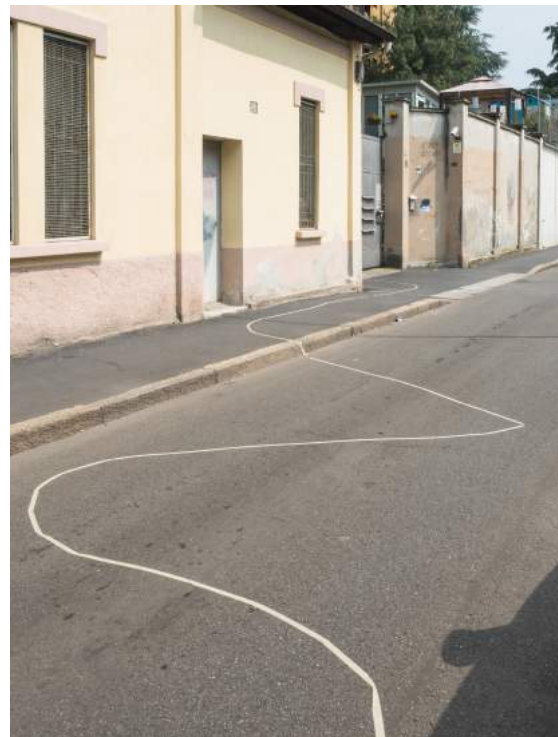
Walking from Scores , workshop.