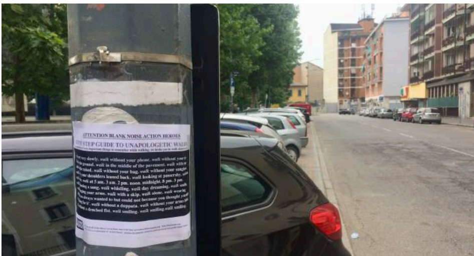
Walking from Scores, Blank Noise, The Step by Step Guide to Unapologetic Walking, Milan Dergano, mai 2018.

À l'occasion de sa première présentation à Bologne lors de Catacomb Bomb (2014) les partitions ont été distribuées au public en photocopies à la sortie des différents lieux du festival, pour insister sur le seuil entre intérieur et extérieur, occuper les espace-temps interstitiels entre les performances et accompagner le public dans ses trajectoires d'un espace à l'autre. De plus, deux partitions ont été choisies et interprétées collectivement par un groupe d'artistes et musiciens impliqués dans un atelier théorique-pratique. À d'autres occasions (Rome, Spring Attitude Festival 2017 et Bologne, Ascolti Verticali , Le Serre de Giardini Margherita, 2017) le projet a pris la forme d'un workshop et d'une série de performances collectives ou alors d'un display des partitions distribuées en libre service dans un espace d'exposition et affichées dans les rues du quartier (Milan, Standards , 2018).