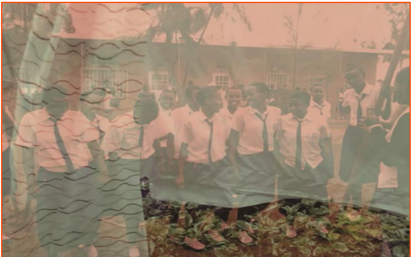
Mugabo, 2016, videostill, courtesy Amelia Umuhire.

In this workshop we will explore the many ways we can tell personal histories and be radically vulnerable by challenging linear narratives and using sound as a transmitter of the unspeakable.