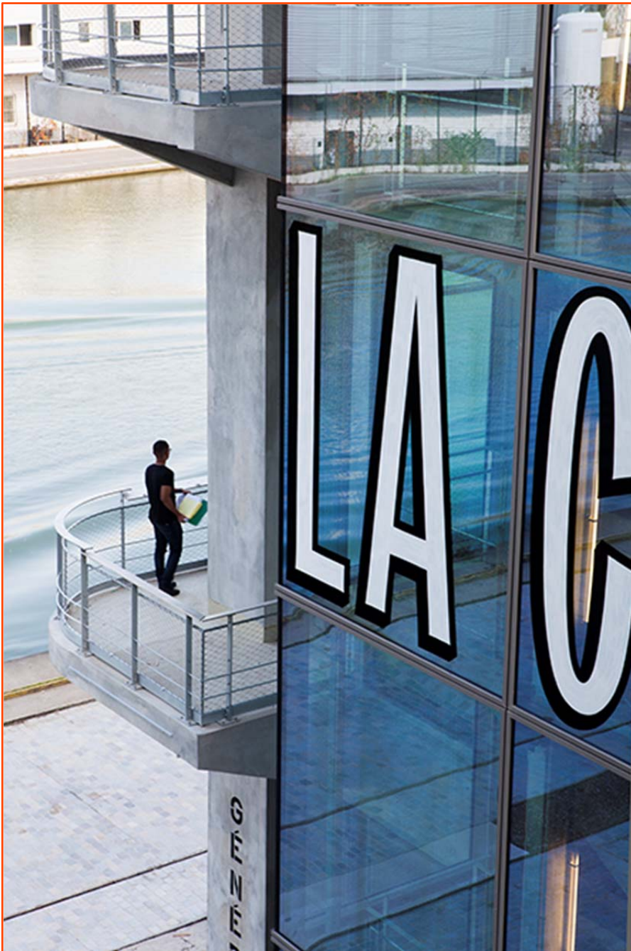
Lettrage peint en façade des Magasins Généraux / BETC Pantin. (Signalétique de Building Paris. Photographie © Julien Lelièvre 2016).